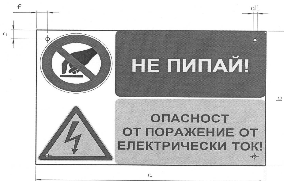
Фиг. 2 Табела „Не пипай! Опасност от поражение от електрически ток!“